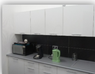
Une cuisine équipée