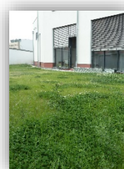
Un espace vert