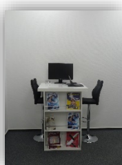
Un espace multimédia avec accès wifi