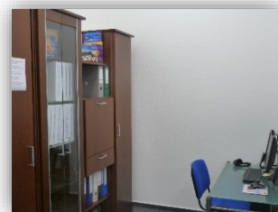
Une salle avec accès à nos plateformes d'apprentissage