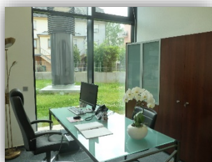
Des bureaux spacieux et accueillants