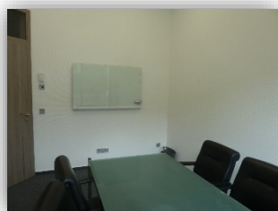
Des salles de cours modernes et climatisées